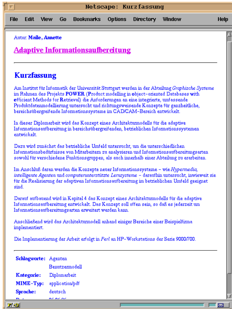
Abbildung 3.6: Beispiel für die Aufbereitung von Abstract und Metadaten