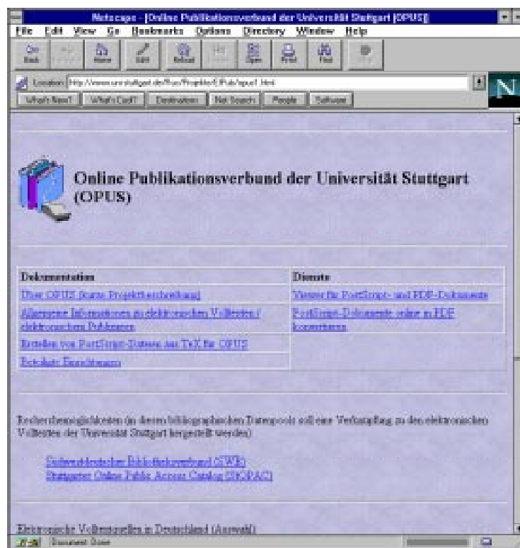
(Abb. 5.1: Basisversion der Einstiegsseite des Projekts im WWW)

Gestaltung und Umfang der Präsentation des Projekts im WWW sind weitgehend abgeschlossen. Zur Zeit ist eine Grundversion an Informationsseiten verfügbar (vgl. Abb. 5.1), die im weiteren Verlauf des Projekts sukzessive erweitert wird.