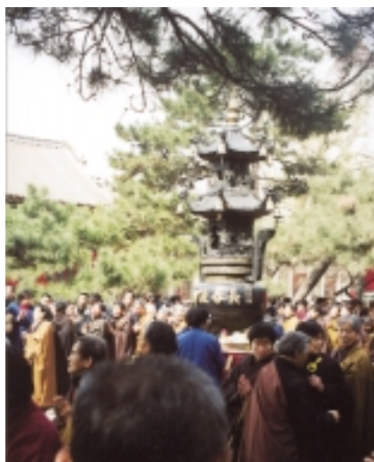
Im buddhistischen Tempel.

– mit Stirn auf dem Boden eines gepflasterten Platzes – um Hilfe in Krankheit und Not baten, als auch die Sitte, dass Dreißig- und Vierzigjährige an einigen Tagen des Jahres Geld für die verstorbenen Ahnen an Straßenecken verbrannten, hielten meine Studenten schlicht für einen immer noch bestehenden Aberglauben. Von den Lehren ihrer großen Philosophen hatten sie nur eine sehr vage Vorstellung. Ich hatte den Eindruck, dass einige der Professoren da auch etwas unbekümmert waren. Sie behandelten die Lehren ihrer Philosophen wie Gebildete in Deutschland die Ethik des Christentums, die sie für sich nach eigenem Gutdünken zurechtformen.