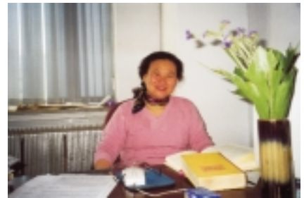
Professor Wang Yaping.

Changchun hat mehrere Universitäten. Eine davon trägt den Namen Northeast Normal University. Sie bildet einen Campus mitten in der Stadt zwischen Kiefern mit Sportplätzen für die Studierenden, mit einem kleinen See, bei dem sich tempelähnliche Gebäude erheben. Und der Zoologische Garten liegt auf der anderen Seite der viel befahrenen, sechsspurigen Straße.