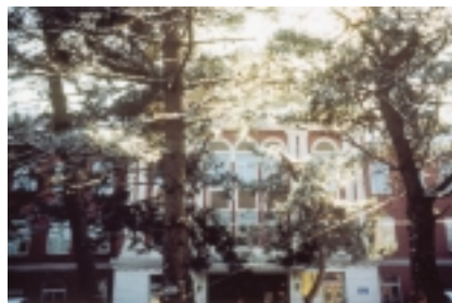
Das Historische Institut.

Changchun hat mehrere Universitäten. Eine davon trägt den Namen Northeast Normal University. Sie bildet einen Campus mitten in der Stadt zwischen Kiefern mit Sportplätzen für die Studierenden, mit einem kleinen See, bei dem sich tempelähnliche Gebäude erheben. Und der Zoologische Garten liegt auf der anderen Seite der viel befahrenen, sechsspurigen Straße.