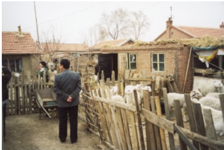
Ausflug „auf's Land“: Ein Bauernhof, der Herd in der Küche.

Ein anderer Student führte alles, was sich an „Erstaunlichem und Wunderbarem“ in der Geschichte ereignete, auf einzelne Personen zurück: auf Alexander, Cäsar, auf Karl und Otto den Großen, auf Kangxi, der auch noch Formosa eroberte, auf Peter den Großen und Napoleon. De-