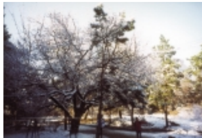
Die Universität im Frühling.

Die Japaner legten breite Straßen an, die heute noch erweitert sind. Was erinnert an die Japaner? Die Studenten weisen auf die Häuser mit den schmalen Fenstern und hohen Treppenstufen hin. Über den „Marionetten-Palast“ und den „Kaiser“ Pu Yi, der dort seine Ahnen verehrte, über die Geschenke vom Tenno an diesen „Kaiser“, über Geschenke von Mussolini und über eine Photographie von Adolf Hitler lächeln sie, aber sie sprechen sonst nicht von dieser Zeit. Jedenfalls nicht bei meinem ersten Besuch in diesem Palast.