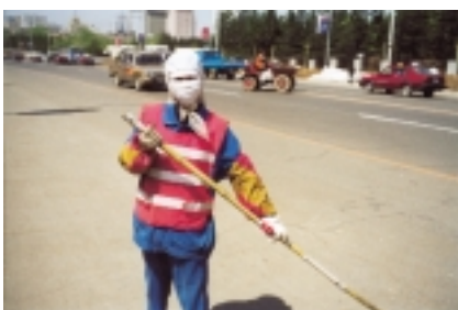
Gesichtsmaske der Straßenfeger und während eines Sandsturms.

Weiter: Sie verbanden eine gewisse Beharrlichkeit mit einer freudigen Phantasie. Dafür zwei Beispiele: Die manchmal sogar etwas obstinate Beharrlichkeit fiel den Sprachlehrern auf. So konnte eine Studentin sich weigern, das englische Wort für „annehmen“, „accept“, korrekt auszusprechen. Ihr erster Lehrer hätte ihr gesagt, es müsse wie „öcept“ klingen und der Hinweis, dass kein Australier es so ausspräche, machte ihr wenig Eindruck. – Voller Phantasie entwarfen sie – ich erwähnte es bereits – Theorien zur genetischen Erklärung des Geschichtsablaufs. Der Mut zu phantasievollen Ausschmückungen bei Textinterpretationen verwunderte mich bis zum Schluss. Als meine Studenten anhand von drei Texten des 13. Jahrhunderts sagen sollten, wie unterschiedlich die Wahl des deutschen Königs beschrieben wurde, hat einer von diesen darauf verzichtet, die Texte wiederzugeben und sich statt dessen neue Wahlordnungen ausgedacht, die es nie gab, von denen auch kein Wort in den Quellen stand. Als ich protestierte, blieb er guter Dinge: Er hätte sich das halt so gedacht. Ich habe in meiner Ratlosigkeit schließlich versucht, ihnen bei gemeinsamen Übungen zu zeigen, wie die Phantasie eines Kriminalbeamten oder eines Detektivs arbeitet, um sie so wenigstens am Text zu halten.