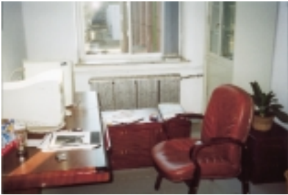
Mein „office“ im Institut.

sie hören, was sie ändern müssen, bei der Themenwahl, bei der Behandlung des Stoffes und bei den Methoden, die sie verwenden. Sie beharren durchaus auf Selbständigkeit und akzeptieren keineswegs alles, aber sie wollen Stellungnahmen und eine gleichbleibende Freundlichkeit, die nie die Hoffnung aufgibt, dass der Student sich eines Tages so ändern wird, wie der Lehrer es erhofft: „In your eyes nobody is incorrigible.“ Sie sind nicht der Meinung, dass sie den Lehrer immer verstehen müssen, wenn er sie auf die Einseitigkeit ihrer Erklärungsversuche hinweist, aber sie wollen Respekt haben können vor ihrem „teacher“ und erwarten, dass er zu dem, an das er gebunden ist, steht und sich entsprechend verhält.