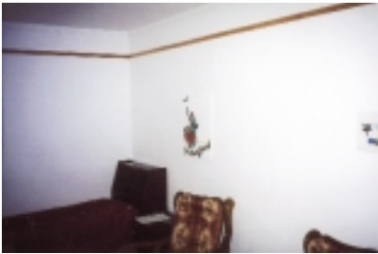
Mein Zimmer im Gästehaus.