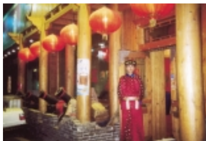
Auf dem Weg zum „working dinner“.

Doch ehe ich davon berichte, erst noch ein allgemeiner Eindruck: Uns allen fiel auf, dass den Studenten die Traditionen ihres eigenen Landes kaum bekannt waren und dass diese, soweit sie ihnen begegneten, von ihnen mit Skepsis betrachtet wurden. Sowohl die Tatsache, dass Hunderte (in einer Millionenstadt) in dem einzigen buddhistischen Tempel Buddha