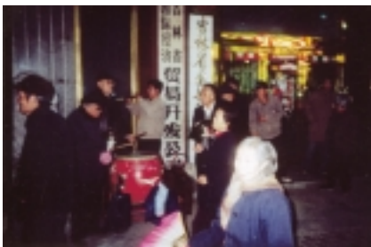
Tägliches Abendkonzert auf einer Hauptstraße.