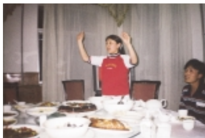
Arie aus der Peking-Oper als Einlage beim „working dinner“.