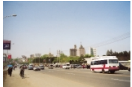
Von der Universität zum Zoologischen Garten.

Sicher, ich hatte den Studierenden zu helfen, sie wöchentlich Arbeiten schreiben zu lassen und diese jeweils schriftlich zu korrigieren. Dazu war ich ja aufgefordert worden. Doch ich wollte die Studenten auch kennen lernen, Studenten der Geschichte, die Englisch gelernt und die ihr erstes Examen bereits abgelegt hatten. Denn - ich war im letzten Weltkrieg zweieinhalb Jahre Soldat gewesen und nach dem Krieg hatte ich gehört, gesehen, wie deutsche Historiker als Studenten, als Lehrende und als Wissenschaftler auf die Ereignisse unter einer nationalsozialistischen Regierung zwischen 1933 und 1945 reagierten. Ich weiß, wie sich Themen und Fragestellungen bei den deutschen Historikern unter dem Eindruck dieser Erfahrungen seitdem änderten. Jetzt wollte ich auch wissen: Wie