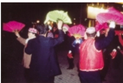
Tanz am Abend auf der Hauptstraße.