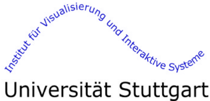
Abbildung 2: Text in SVG

Text kann in SVG sehr flexibel gehandhabt werden (siehe Abbildung 2). Bei der Definition von Text in der Graphik, bleibt der Text an sich im Quelltext erhalten. Dies ist ein großer Vorteil gegenüber Rasterformaten. Damit ist es möglich, textuelle Inhalte in SVG-Graphiken mit Suchalgorithmen zu indizieren.