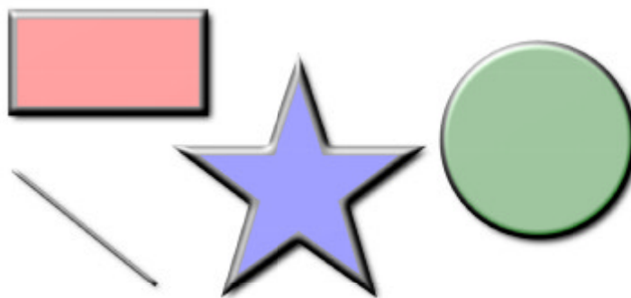
Abbildung 3: Effekte bei elementare SVG-Formen

SVG bietet weit mehr Funktionalität als nur die oben vorgestellten elementaren Formen. In SVG lassen sich nicht nur statische Graphiken, sondern auch dynamische Effekte definieren. Dazu werden Animationsknoten eingefügt, die Zeit- oder Ereignis-getriggert sind. Neben den Attributen von Formen lassen sich Bewegungen, Farben und Transformationen animieren. Das in SVG integrierte Animationsmodell ist an den W3C Standard SMIL angelehnt. Um erweiterte Funktionalitäten zuzulassen, die über Animation und Eventhandling hinaus gehen, können SVG-Graphiken per Skript gesteuert werden (über [ECMAScript, JavaScript] etc.). Alle Elemente der SVG-Graphik lassen sich dann über das Document Object Model [DOM] adressieren.